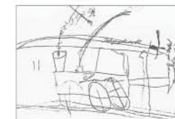
Ernst Ludwig Kirchner „Lokomotive“, 1883

„Die frühe Kindheit von Ernst Ludwig Kirchner in Aschaffenburg“