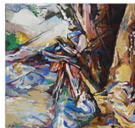
Eckehard Fuchs „landscape“ Öl auf Leinwand 130x140cm, 2015

Die Künstler Paola Alborghetti, Eckehard Fuchs und Irene Wieland gestalten den Kunstsommer am Roten Haus. Zu sehen sind an den Wochenenden Ausstellungen und das Künstleratelier mit den vor Ort entstandenen Arbeiten. geöffnet Sa/So 10 bis 18 Uhr